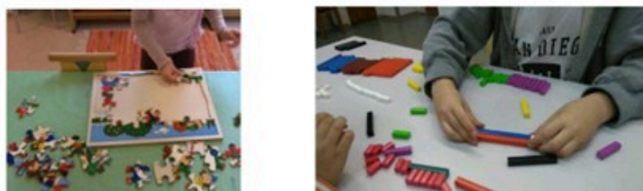
Tutkin ja toimin ympäristössäni