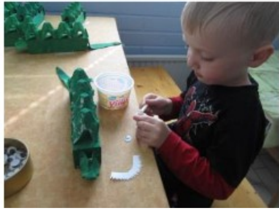
Ilmaisun monet muodot