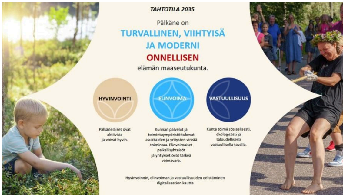
Pälkäne Parasta Aikaa 2035

Pälkäneen kunnassa on kuntastrategia 2035. Pälkäneen kunnan arvot ovat: avoimuus, yhteistyö ja vastuullisuus. Pälkäneen esiopetuksen arvot ovat yhdensuuntaiset kunnan arvojen kanssa.