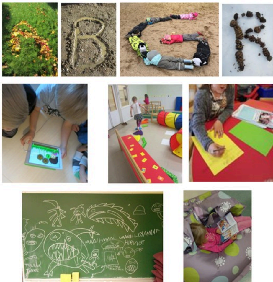
Kielten rikas maailma

Pälkäneellä lauletaan, leikitään, lorutellaan, tehdään omia tarinoita esimerkiksi sadutuksen keinoin. Esiopetuksen alkaessa tehdään alkukartoitus lapsen kielellisistä taidoista käytössä olevien materiaalien avulla. Tutkitaan ääniteitä, tavuja ja sanoja. Innostetaan lasta leikilliseen kirjoittamiseen sekä omien tekstien tuottamiseen. Lapset saavat kokemusta erilaisista tavoista tuottaa tekstiä leikkillisesti tieto- ja viestintäteknologiaa hyödyntäen.