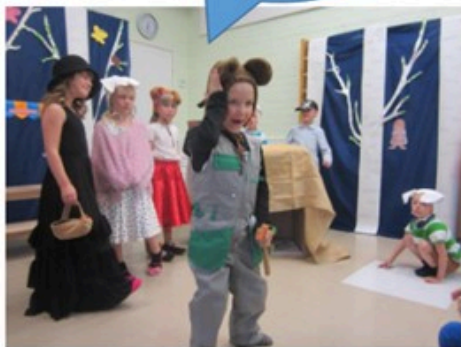
Ilmaisun monet muodot