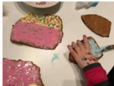
Kasvan ja kehityn

Pälkäneellä keskustellaan lasten kanssa kuluttamisen kulttuurista. Kierrätysmateriaalin sekä lahjoituksena saatujen lelujen ja pelien kautta huomaamme, että myös käytetty voi olla toiselle käyttökelpoista. Pälkäneellä kannustetaan pitämään oppimisympäristöstä välineineen hyvää huolta. Huolletaan ja korjataan tarpeen tullen myös yhdessä lasten kanssa.