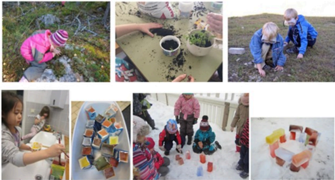
Tutkin ja toimin ympäristössäni

Tutkiva ja kokeileva oppiminen on keskeinen osa esiopetusta. Lapset harjoittelevat kysymysten esittämistä, havaintojen tekemistä ja niiden jäsentämistä. Heitä kannustetaan vertailemaan, luokittelemaan ja pohtimaan syy-seuraussuhteita. Pienet kokeet sekä havainnointi- ja dokumentointivälineiden käyttö tukevat lasten tiedon rakentumista.