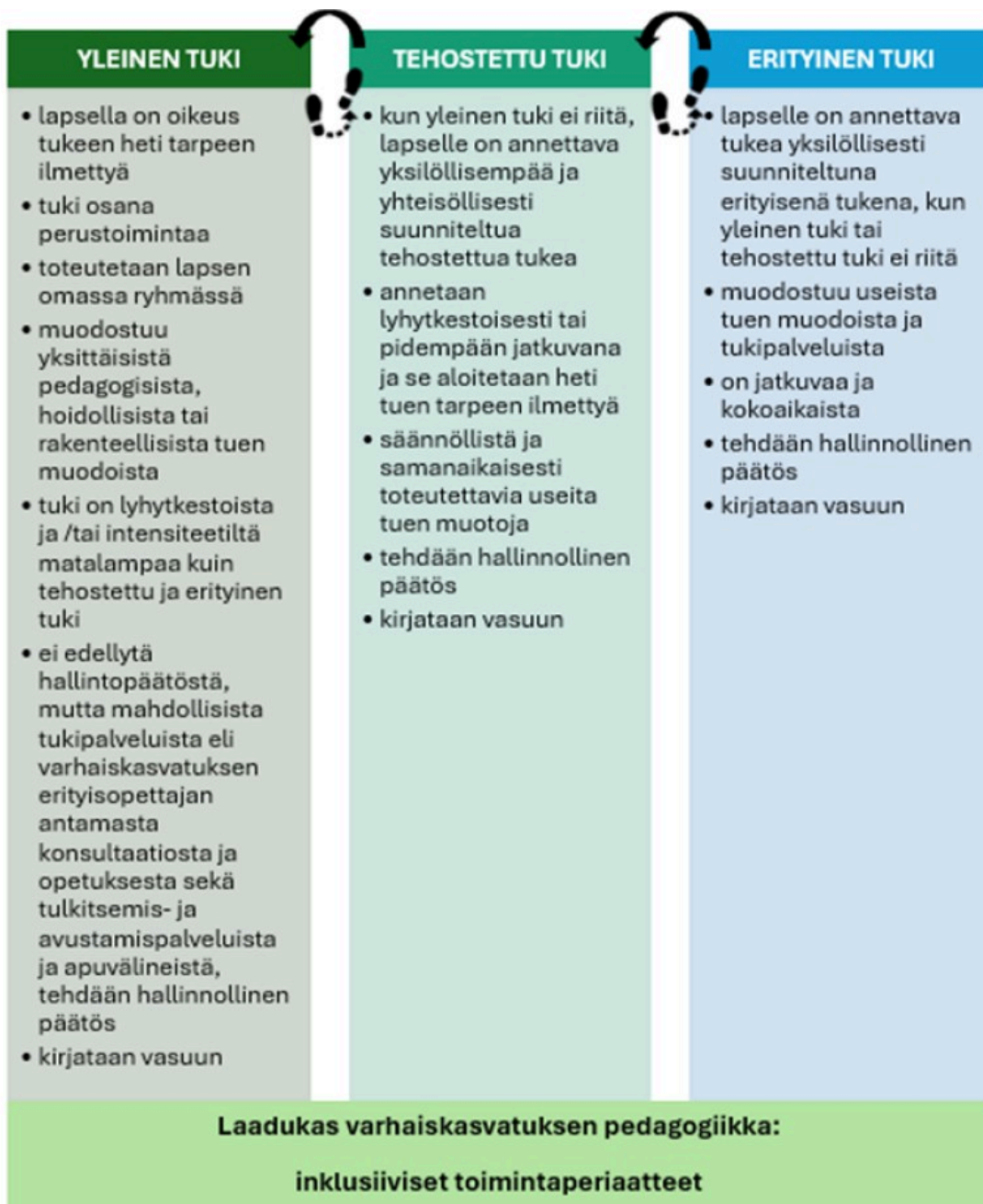
Tuen askeleet Pälkäneellä