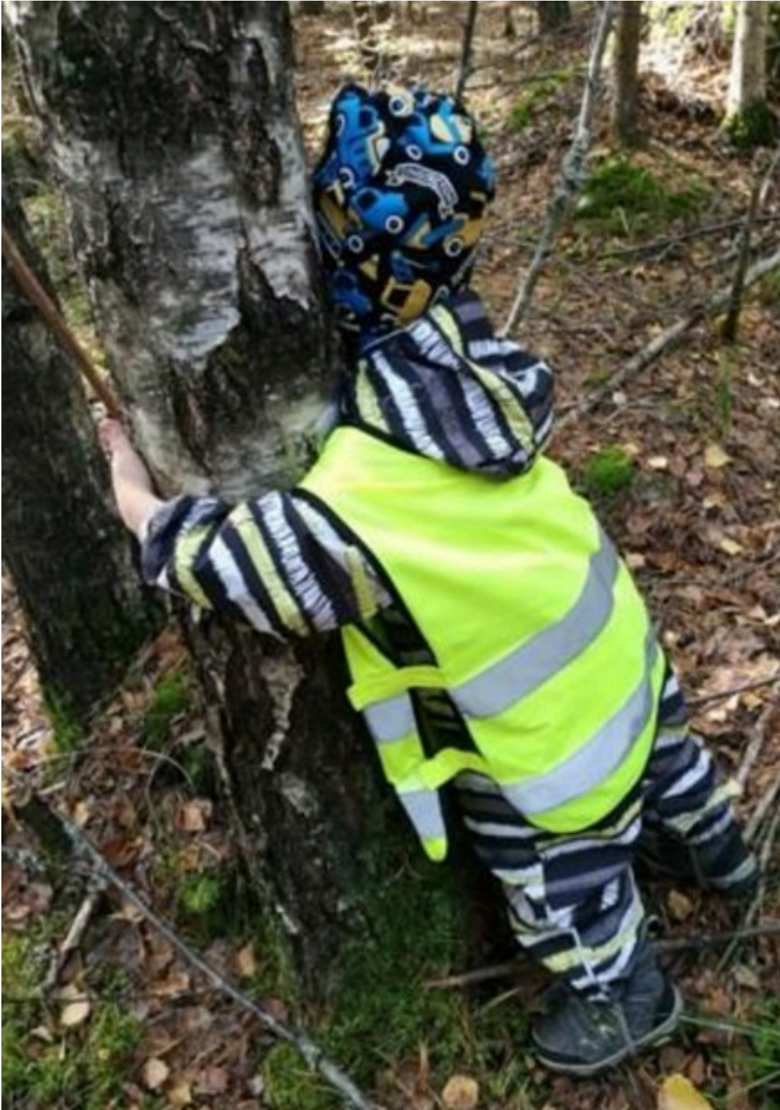
Metsä hoivaa ja rauhoittaa

Luonnossa toimimisen tueksi varhaiskasvatukselle laadittiin oma ympäristökasvatussuunnitelma vuoden 2023 aikana. Suunnitelmassa muun muassa esitellään lähiseudun retkikohteita, materiaalivinkkejä sekä vuosikello, jonka avulla voimme toiminnassa huomioida erilaisia teemapäiviä sekä –viikkoja. Suunnitelmassa huomioimme ympäristökasvatuksen ulottuvuudet; oppimisen ympäristöstä ja ympäristössä sekä toimimisen ympäristön puolesta.