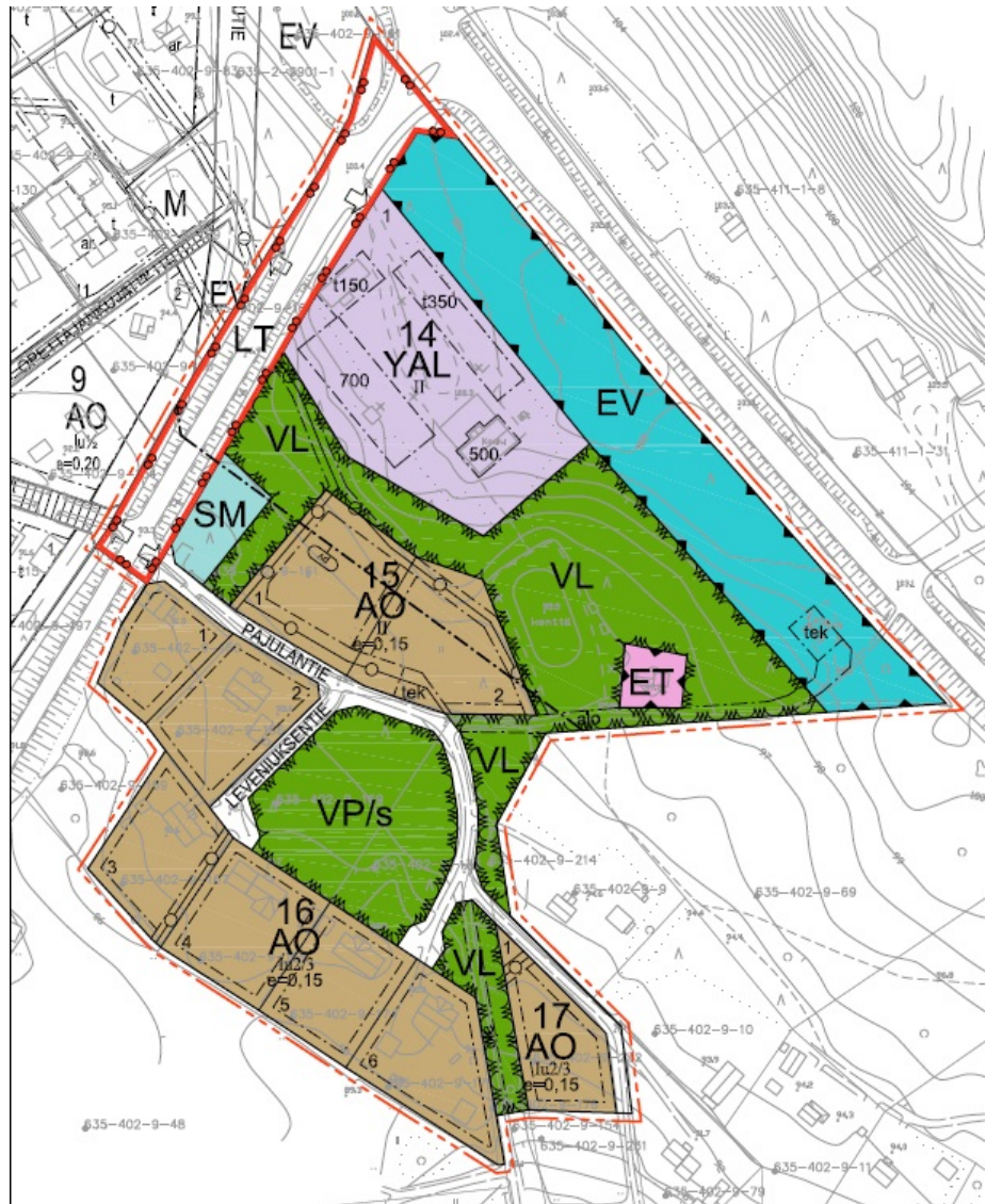
Kuva 1. Kaavaluonnos

Asemakaavassa Harhalan koulun alueelle on muodostettu yleisten rakennusten sekä asuin-, liike- ja toimistorakennusten korttelialue, kortteli numero 14 (14 YAL). Korttelialue on osoitettu koulun nykyisen piha-alueen mukaisesti. Korttelin pinta-ala on 7921 m 2 . Suurimmaksi sallituksi kerrosluvuksi on osoitettu 2. Rakennusoikeutta on yhteensä 1700 k-m 2