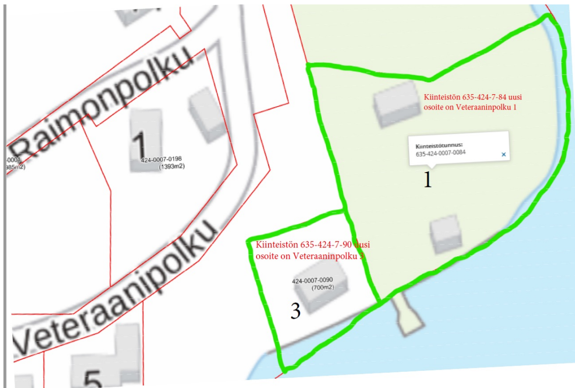
Kuva1. Osoitteenmuutoksen alaiset kiinteistöt rajattu vihreällä ja uudet osoitteet kirjattu punaisella.

Varamaan alueella on kaksi kunnan omistamaa kiinteistöä, joilla on tällä hetkellä osoitteet Kostiantielle. Asemakaavan mukainen tie on Veteraaninpolku, jolle kiinteistöjen osoitteet tulisi osoittaa (kuva1).